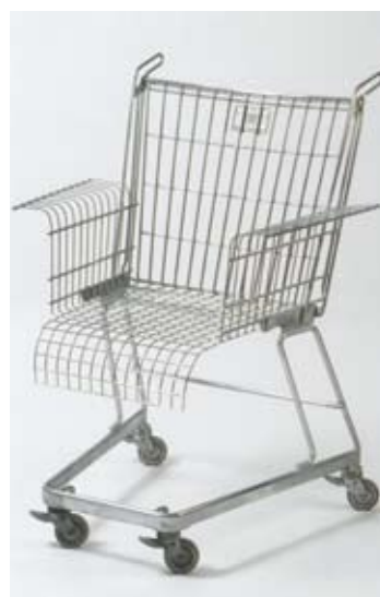
← STUDIO STILETTO Consumer's rest