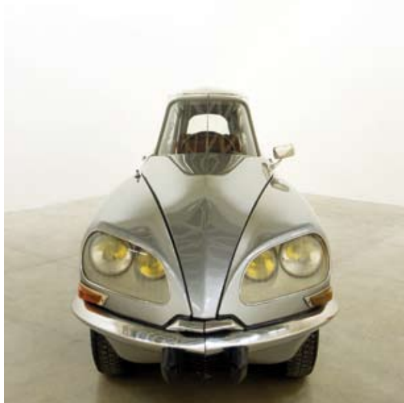
← GABRIEL OROZCO La D.S.

Les œuvres du second plateau analyseront les échanges, articulations et interactions qui peuvent exister entre l'artiste et la société, dans son rapport au monde marchand, à l'environnement, au politique, aux conflits... Un grand nombre de ces œuvres pointeront les failles d'une société basée sur l'image et la consommation.