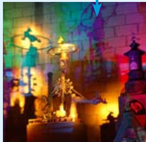
Tap Szin haz