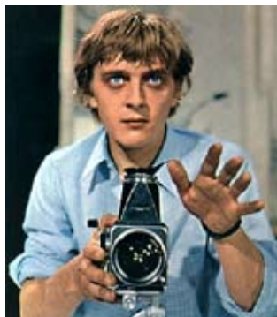
↑ Blow up → Ipcress, danger immédiat → Performance