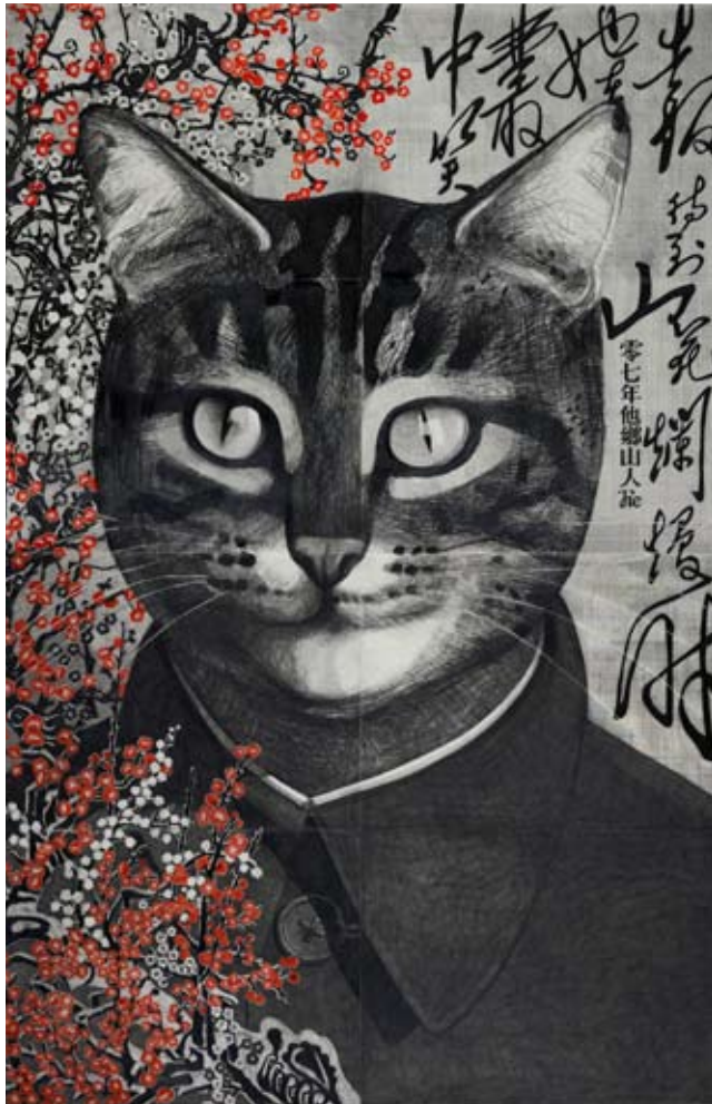
→ LA ROUTE DE LA SOIE QIU JIE "Portrait of Mao", 2007 Lead on paper, 250 x 168 cm © Qiu Jie