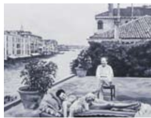
→ FROM L GALERIE VERTIKALL, LILLE