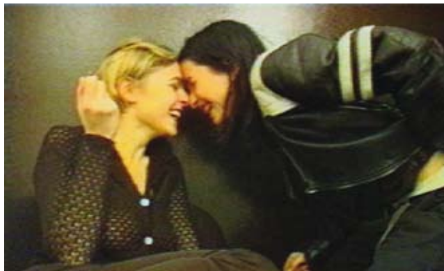
→ SHI XINNING "A HOLIDAY IN VENICE - AT THE BALCONY OF MS. GUGGENHEIM", 2006 210 x 272 cm, Huile sur toile