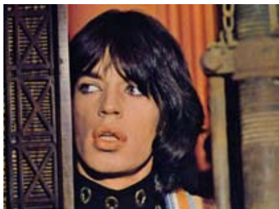
← My Beautiful Laundrette